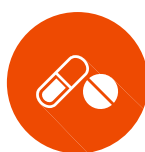
LES FRAIS MÉDICAUX