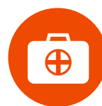
L'ASSISTANCE / RAPATRIEMENT