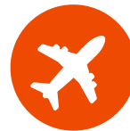
L'ASSURANCE PERTE ET VOL DE BAGAGES

Il ne vous reste plus qu'à choisir votre zone d'expatriation :