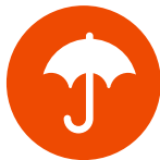
L'ASSURANCE REVENUS (LA PRÉVOYANCE)