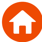
LES RESPONSABILITÉS CIVILES VIE PRIVÉE ET LOCATIVE