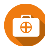
L'ASSISTANCE / RAPATRIEMENT