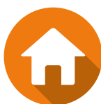
LES RESPONSABILITÉS CIVILES VIE PRIVÉE ET LOCATIVE