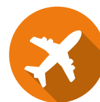
L'ASSURANCE PERTE ET VOL DE BAGAGES

Il ne vous reste plus qu'à choisir votre zone d'expatriation :