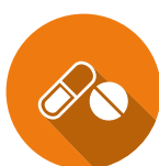
LES FRAIS MÉDICAUX